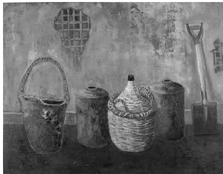
刻む 2015 F80 第70回県美展