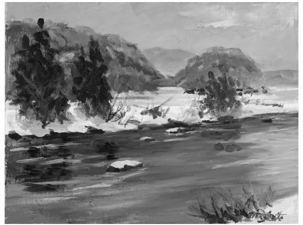
冬の最上川(碁点) 2003 F6