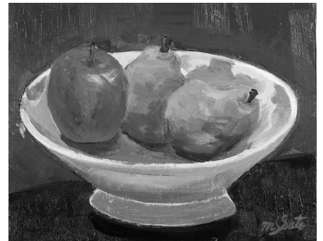
りんごとラ・フランス 2016 F4