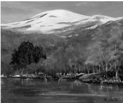
早春(五色沼より) 2017 F8