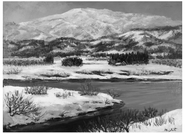
北の山河 2000 F80 第55回県美展