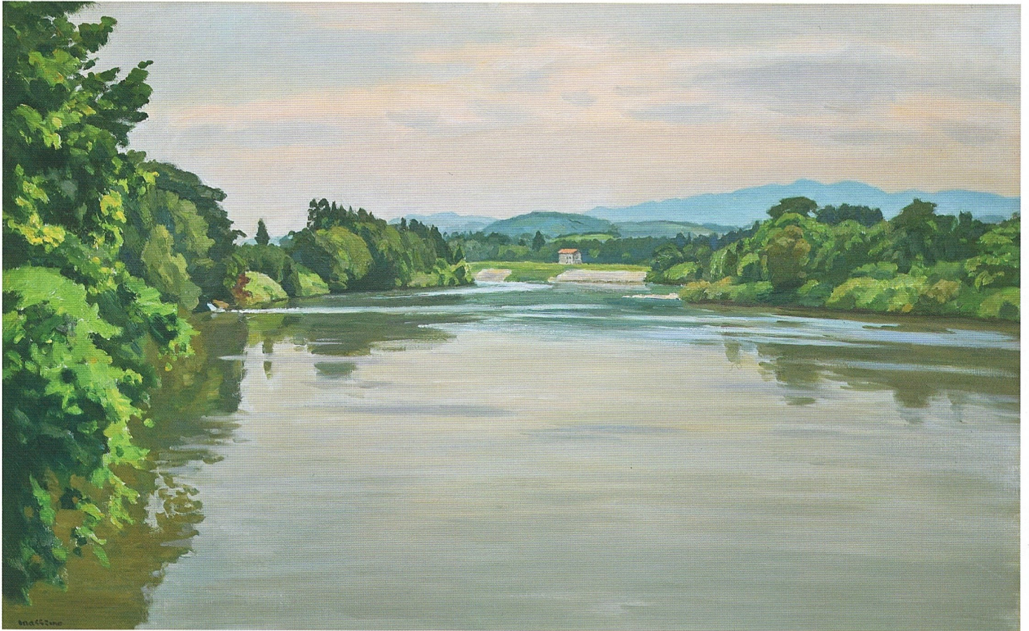
大淀の最上川 1973年(昭和48)年 M50 村山市大淀