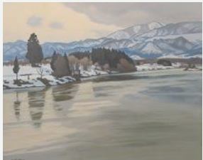
浅春最上川 1990年 F100 村山市