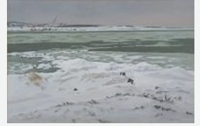
冬・河口のあたり 1986年 P80 酒田市

会期が変更になる場合はご容赦くださいますようお願い申し上げます。 最新情報は村山市公式ホームページをご覧ください。最上川美術館 (0237-52-3195) までお問い合わせください。 催し(ギャラリートーク、ワークショップ等)や臨時休館日は村山市公式ホームページに掲載いたします。