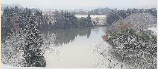
「村山市ライブカメラ」から現在の最上川の様子をご覧いただけます