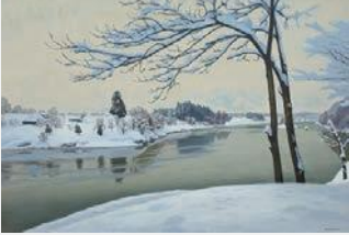
雪の河畔 1981年 F120 村山市