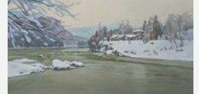
雪の隼の瀬 1988年 変形M80 村山市