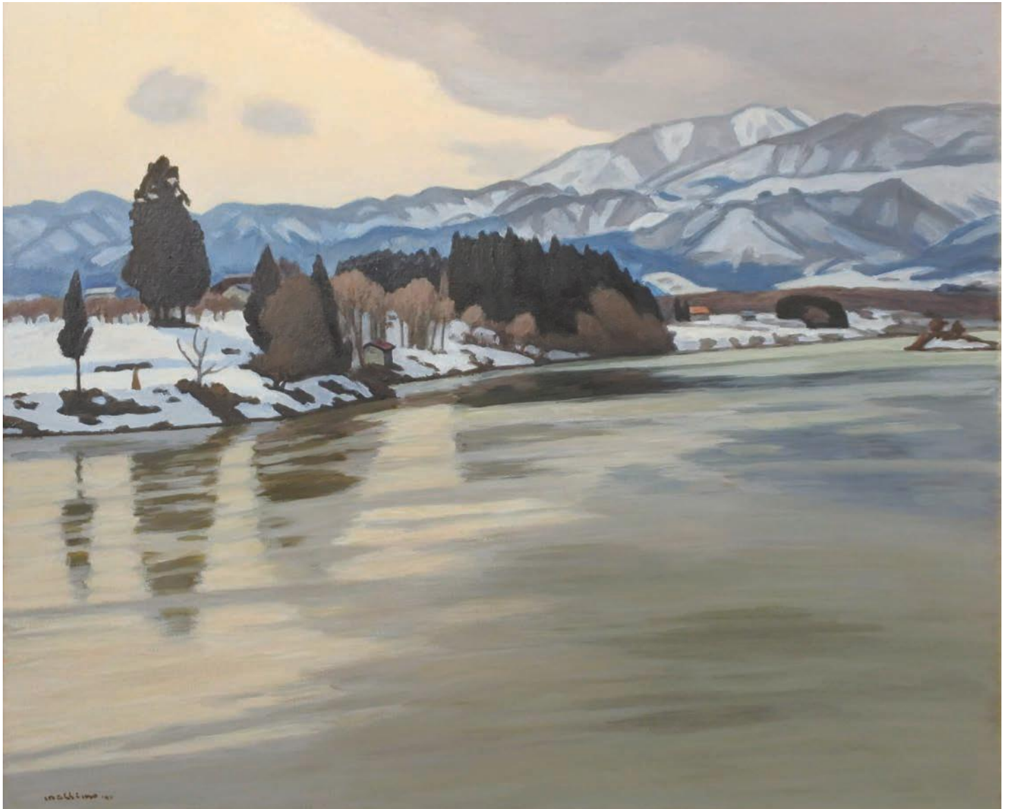
『浅春最上川』 1990年（平成2年）制作 F100 村山市大淀

第22回改組日展に出品した『浅春最上川』は、真下慶治76歳。最晩年の代表作です。春まだ浅く雪の残る村山市大淀河畔で描かれました。煌めく光彩を放つ空、水、雪、風、人、万物すべてが春を待ちわび、自然の中で生き生きと輝き始めます。