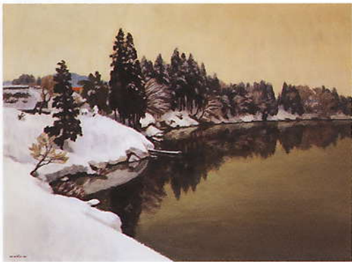
雪の大淀 1981 60号 油彩

私は画家として、より直感的に動物的に、自分を育ててくれた自然として、郷土愛とでもいった絆で接しているといえるかと思う。ただそれが狭い郷土愛だけにならぬよう、何処の風景、自然にも潜んでいる普遍の美一力(造化の妙とでもいうか)を同時に表せたらと念じている。 最上川は年々日々変わる。新しい道路が出来、新しい橋が架けられる。次々と新しい最上川風景が展開する。探れども尽きない。描けども描けども描き尽くせない。だが私は描き続けよう―「母なる最上川」を。