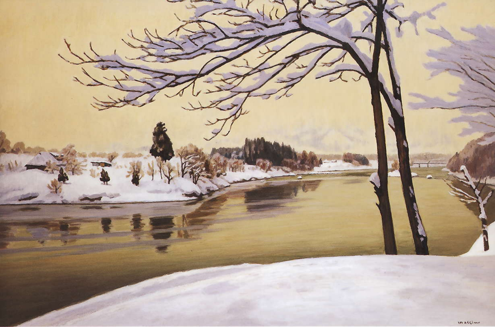
雪の河畔 1981 120号 油彩