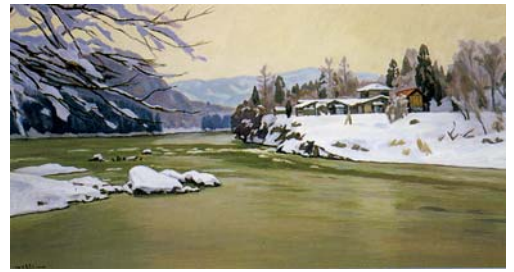
雪の隼の瀬 1988年制作