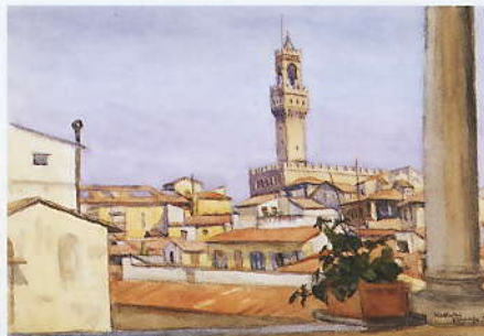
「フィレンツェ」 1955 水彩