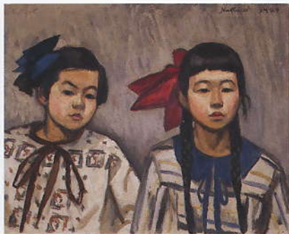
「姉妹」 1924 油彩