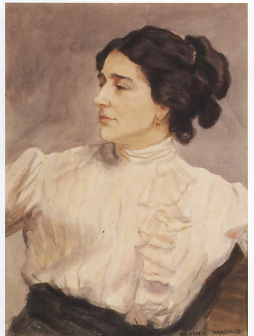
「西班牙の女」 1912 水彩