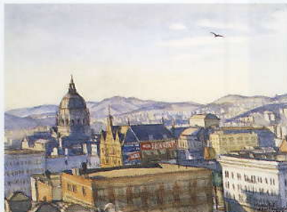
「薬港の朝」 1954 水彩