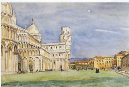
「ピザの斜塔」 1955 水彩