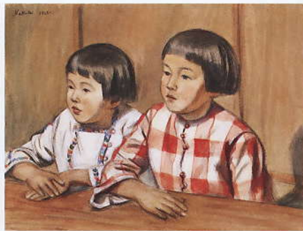
「燈火二少女」 1926 水彩