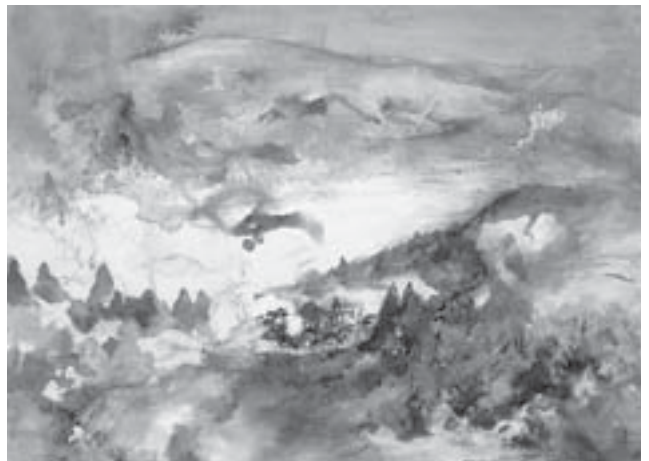
「月山望郷(絶筆)」個人所蔵