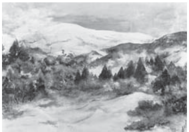
「雪国の春(月山)」村山市所蔵