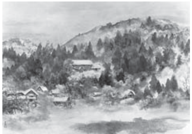
「春きたる」南河島公民館所蔵