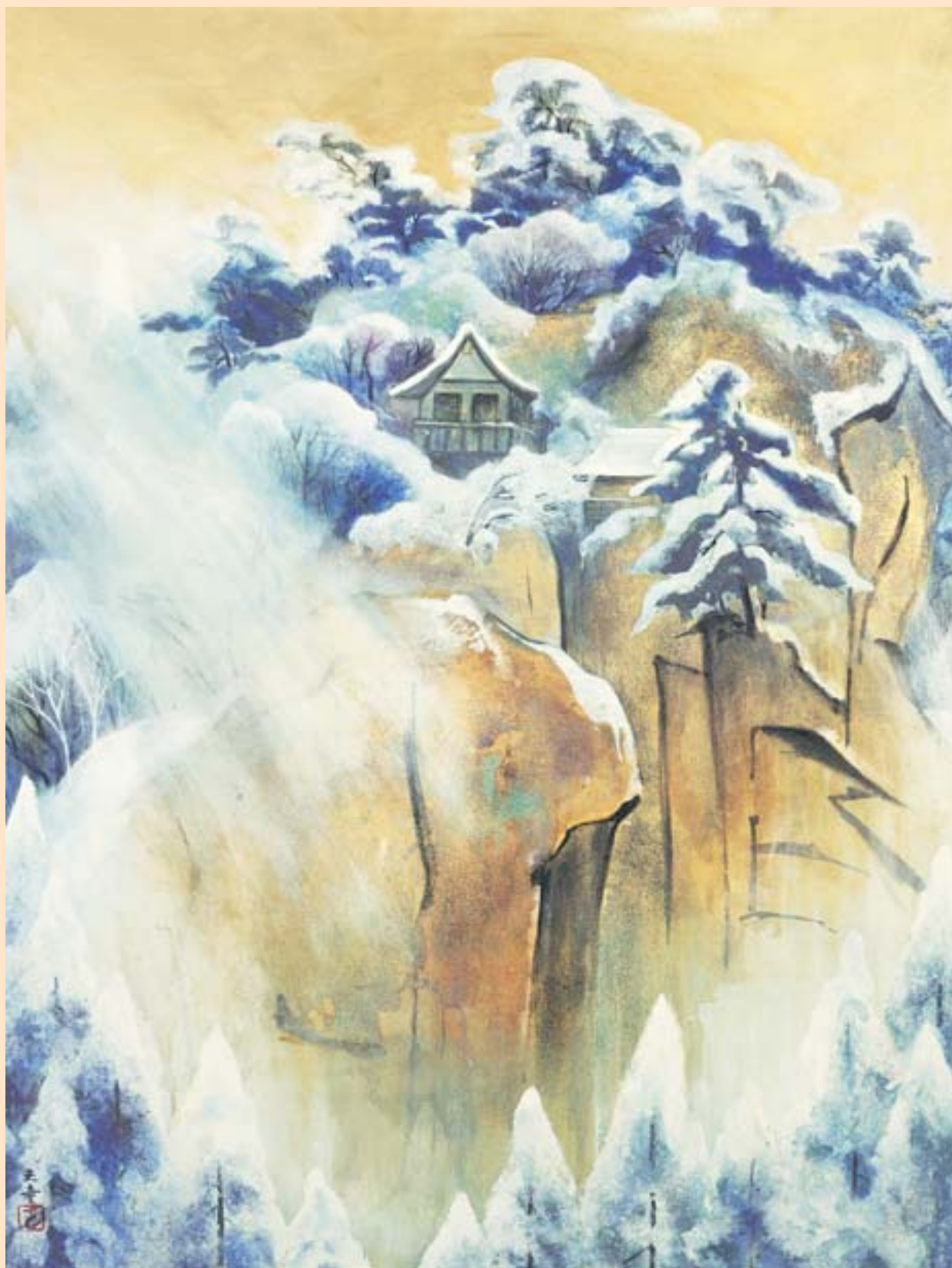
「雪の山寺」山形美術館所蔵