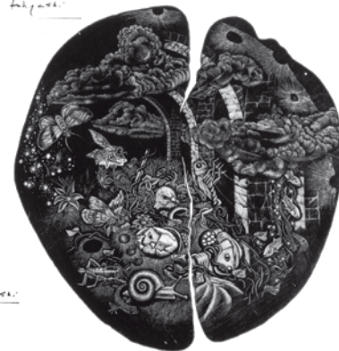
67 遺された部屋 No.4 The chamber No.4 遺された部屋 -No.4-