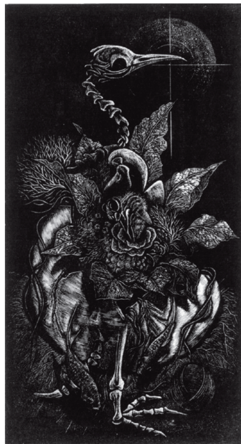
19/40 アブラム・ボツから アブラム・ボツから