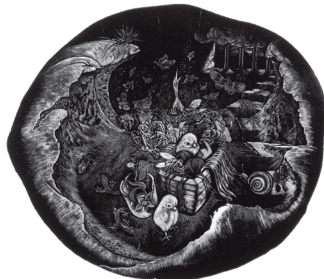
66 遺された部屋 No.7 The chamber No.7 遺された部屋 -No.7-