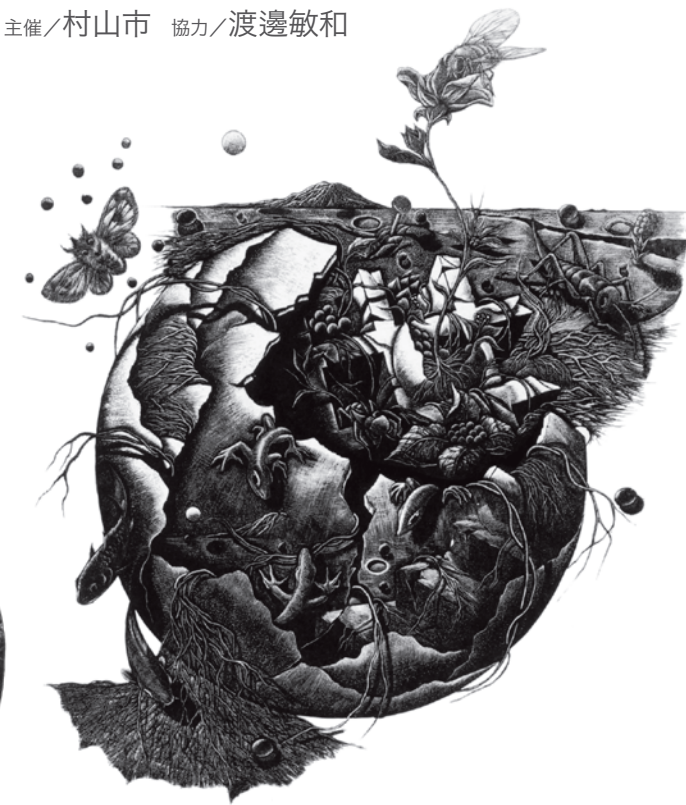
68 遺された部屋 No.12 The chamber No.12 遺された部屋 -No.12-