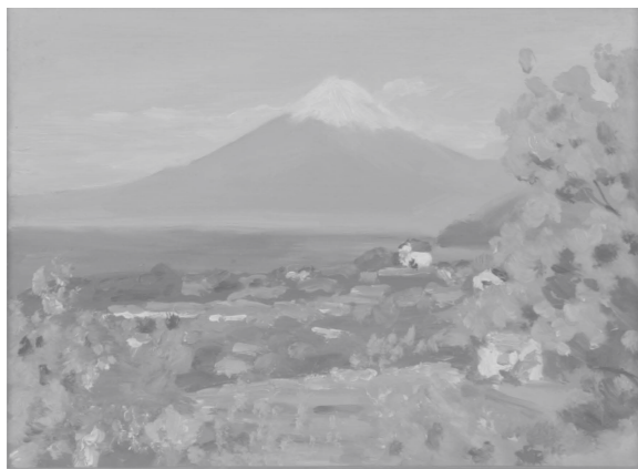
富士山 -西伊豆- 1980年 4F