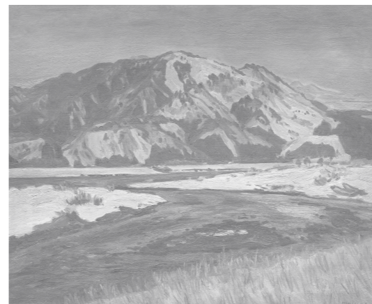
冬の山河 1946年 20F 庄内町(狩川) 酒田 松山文化伝承館