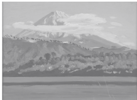
富士山 -山中湖- 1968年 4F