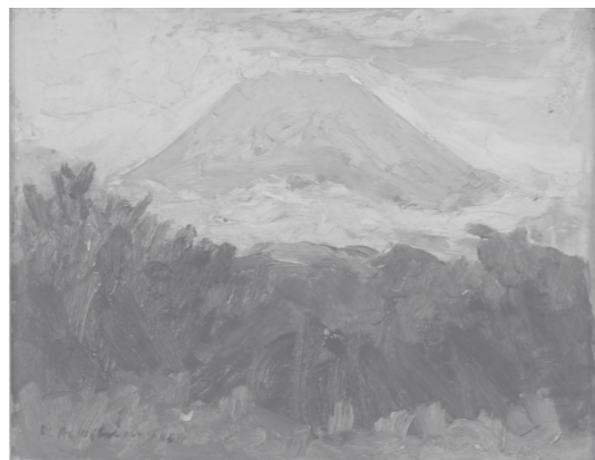
富士山 -三島- 1934年 3F