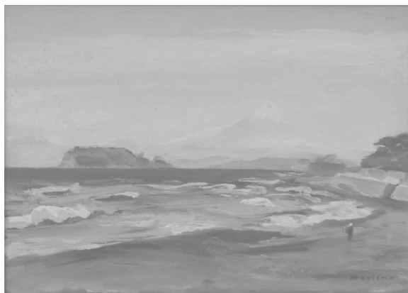
富士山 -由比ヶ浜より- 1934年 4F