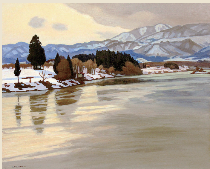
真下慶治 「浅春最上川」 1990 F100 日展改組22回 村山市大淀