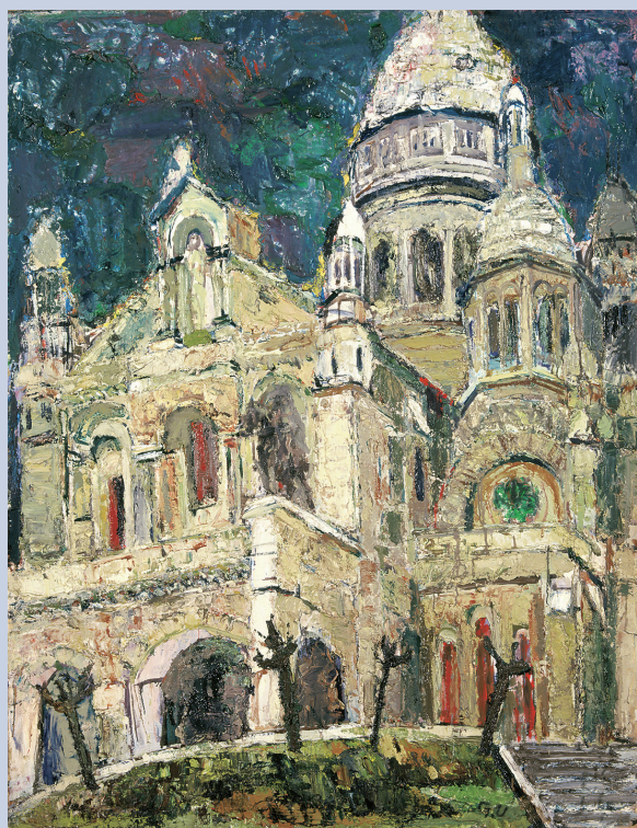
梅津五郎 「サクレクール寺院」 1967 F80 日展第10回 フランス パリ