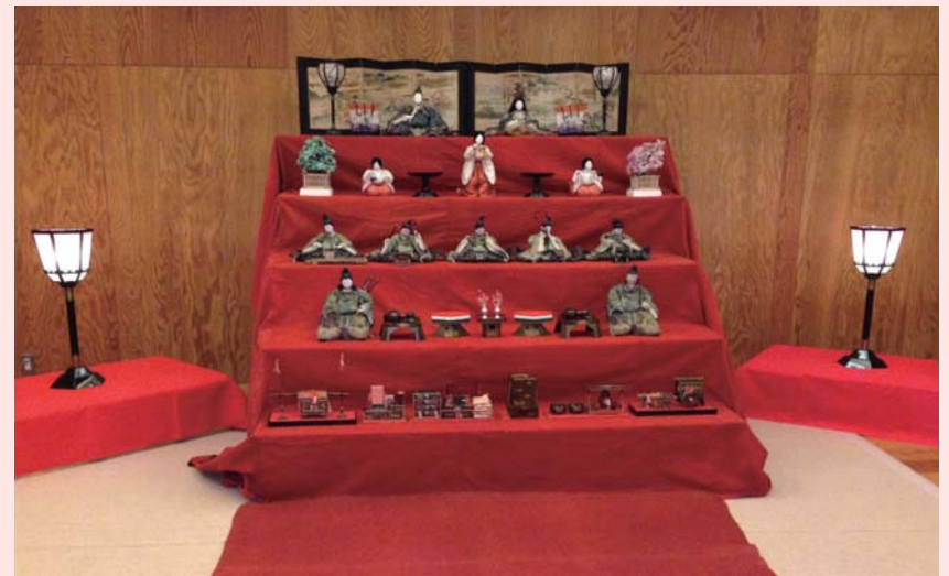
古今雛 (第二代原舟月) 雛道具 江戸後期