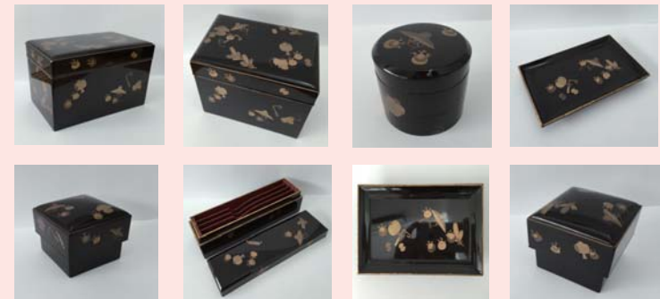
松竹宝尽蒔絵化粧道具揃 江戸中期