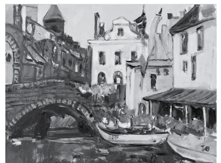
ベルギー風景 6号 油彩・キャンバス