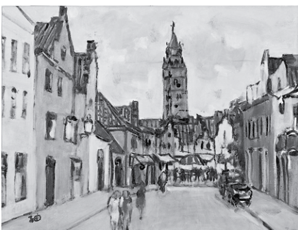
オランダ風景 6号 油彩・キャンバス