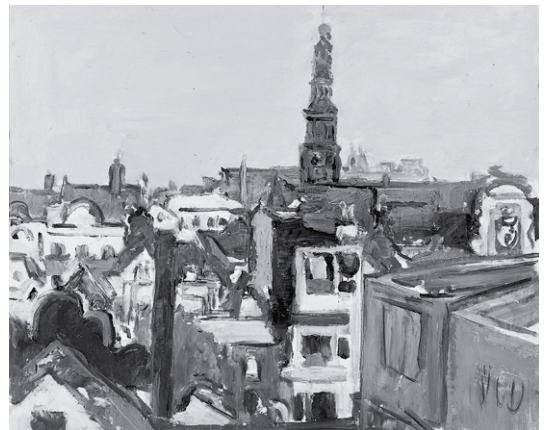
オランダ風景 8号 油彩・キャンバス