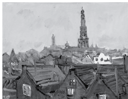
オランダ風景 6号 油彩・キャンバス