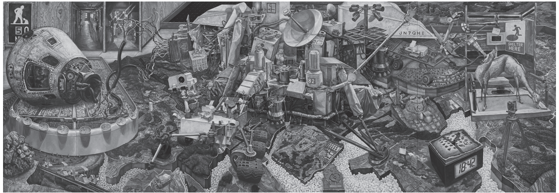
《記憶のジオラマ》油彩、綿布、パネル、182.0×520.0cm、2015年