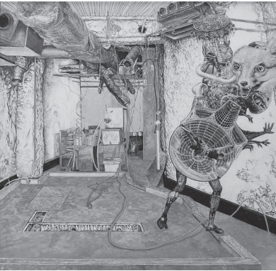
《運ぶ者》(部分) 油彩、テンペラ、コラージュ、写真転写、金箔、白亜下地、綿布、パネル、72.5×72.5cm、2017年