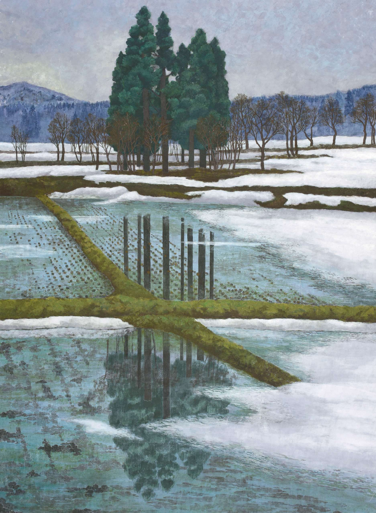
東風吹く頃 2004年 F60 大石田町