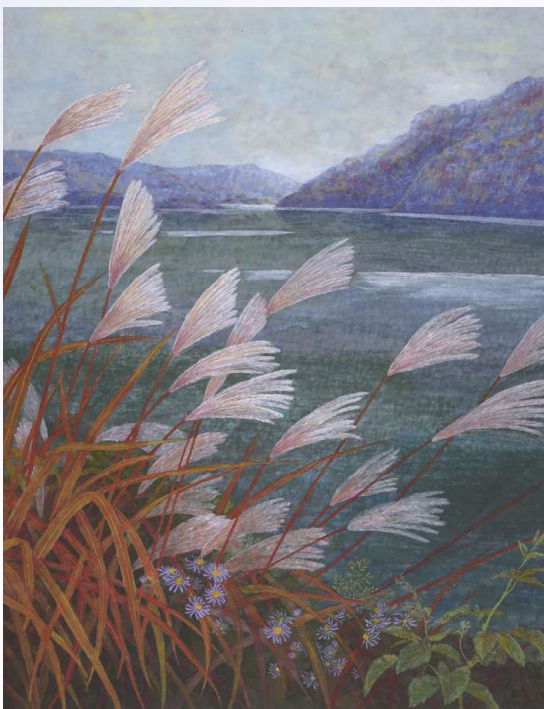
秋の詩 2007年 F50 山形市