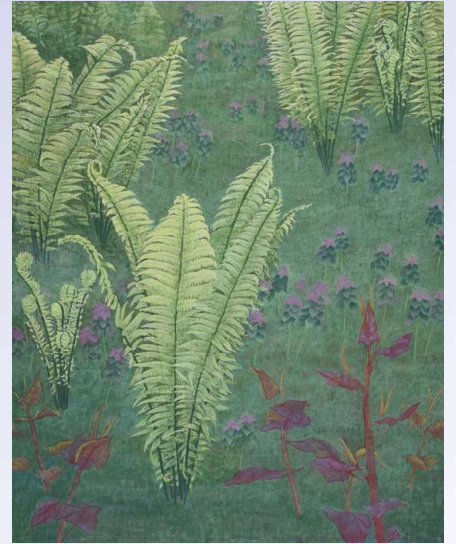
春の詩 2006年 F40 村山市湯野沢

ここに今までの足跡を振り返る機会をいただきましたことに深く感謝いたしております。どうぞご覧いただきまして、皆様方からのご教示ご批評を頂戴できればうれしく思います。