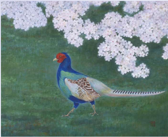
春の庭 2016年 F20 村山市湯野沢