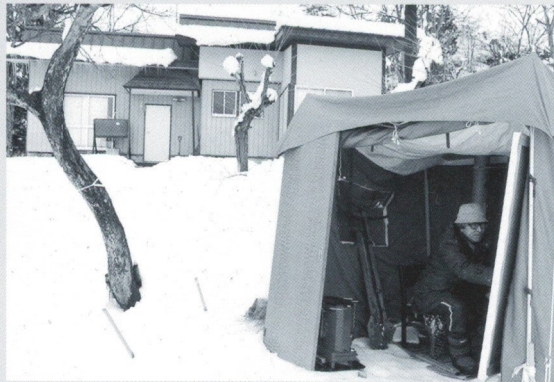
大淀アトリエ前で窓付きテントを張って制作した